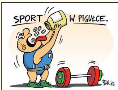
rys. Mirosław Andrzejewski

Nazwij problem przedstawiony na rysunku satyrycznym.